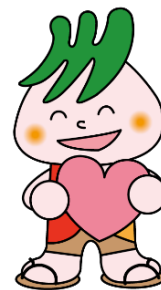
川口市社協マスコット 「社助」