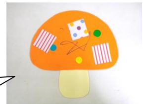
きのこにお絵描きをしてシールなどで飾りました

ポッポ♡では雨の日などのすいている時間に、製作のお誘いをしています。生まれて初めてクレヨンを持つ子、シールやのりで飾りを貼ることを楽しむ子など様々で、個性豊かな作品がポッポ♡を飾ってくれています。秋は「きのこ」の製作をしています。みんなでかわいいきのこを作ってね♪